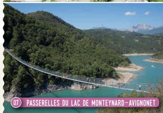
07 PASSERELLES DU LAC DE MONTEYNARD-AVIGNONET