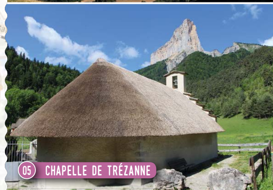
05 CHAPELLE DE TRÉZANNE