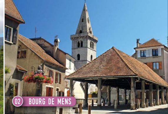
02 BOURG DE MENS