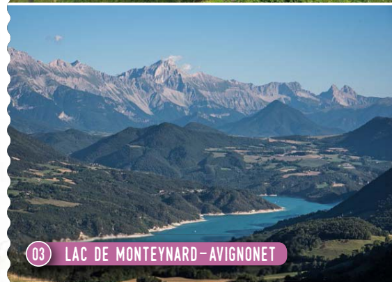
03 LAC DE MONTEYNARD-AVIGNONET