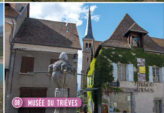
08 MUSÉE DU TRIÈVES