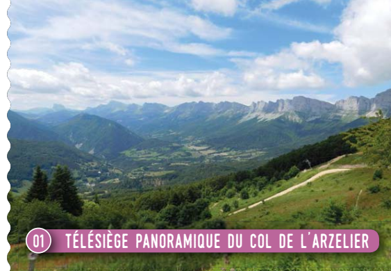
01 TÉLÉSIÈGE PANORAMIQUE DU COL DE L'ARZELIER