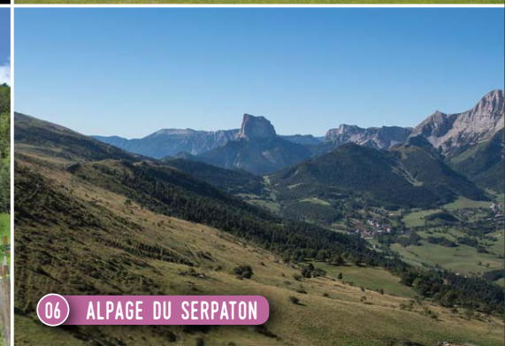
06 ALPAGE DU SERPATON